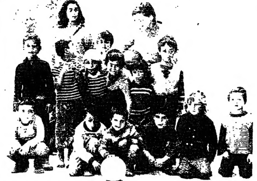
عبودهم حزن واسئلة كثيرة

أمس كانوا... ظل من الذين كانت مسرحيات حلوة ومباريات رياضية. نسيم العيد، يلعبون ويرقصون ويلهون... أسبوع الآلام الذي كان حطبا على الأطفال ويككون، بدعوة من نادي الخدمات الاجتماعية المرحلين، هل ينهي بقبالة قريبة... أم أن في الأثرناشونال كولاغ، وفي برنامج اليوم صليوبم التفتيل باق حتى اشعار آخر؟